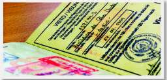
Russland - Südossetien