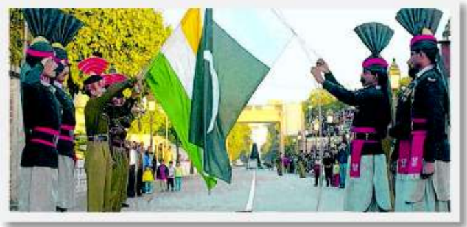
Indien - Pakistan