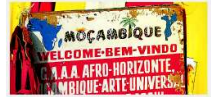
Swasiland - Mosambik