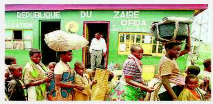
Ruanda - Kongo