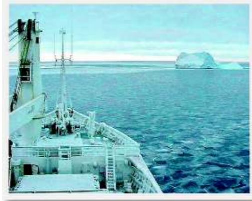
Russland - Norwegen