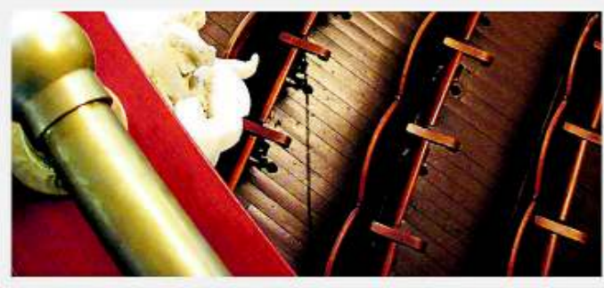
USA - Kanada